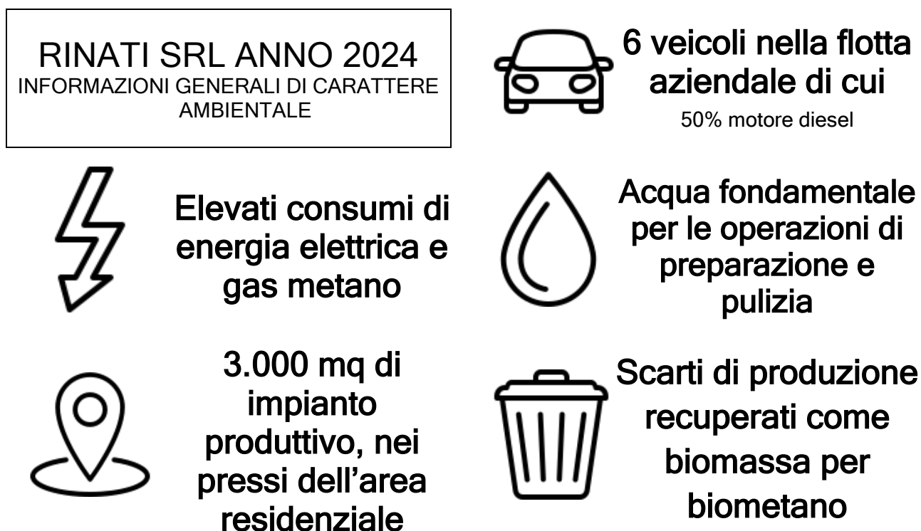
Tab 2 informazioni generali di carattere ambientale di Rinati Srl al 2024

La scelta di Rinati Srl di avviare nel 2025 la rendicontazione ESG nasce dal suo impegno e dalla sua crescente attenzione alla sostenibilità. L'obiettivo dell'analisi effettuata è quello di comprendere lo stato attuale e individuare possibili aree di miglioramento. Nella tabella seguente sono riportate le informazioni necessarie per esaminare la rilevanza dei temi ambientali sia per l'azienda che per i suoi stakeholder. L'analisi successiva mira a identificare potenziali criticità, monitorarle negli anni a venire ed individuare strumenti utili per contenere il proprio impatto a tuttotondo, proteggendo al contempo l'azienda dai rischi connessi alla crescente crisi che abbraccia più fronti, non solo quello ambientale.